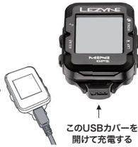
このUSBカバーを開けて充電する

※機器と接続しても充電マークが表示されない場合、そのUSBポートに電気が流れていません。他のUSBポートに挿し込んでください。