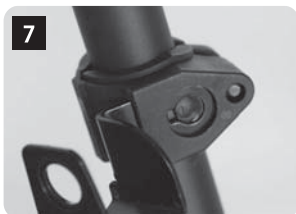
しっかりと噛むまで押し込みます。これでマウントの取付けは完了です。