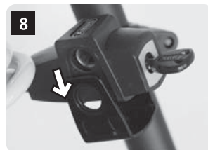
カギ本体を装着します。ロックをはずし、ワイヤーが抜けた状態でシリンダー部をマウントに入れます。