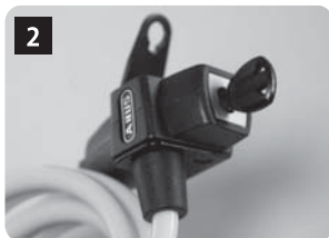
本体に取り付けられたLLフォルダー(金属製)を取り外します。まず、キーロックを解除します。