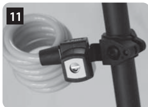
これで装着完了になります。取り外す時は、ロックを外して上へ抜き取ります。