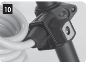
シリンダーにワイヤーを差し込み固定します。