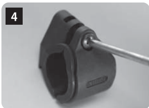
つづいてURBマウント(プラスチック製)のねじを緩めてシートポストに装着します。