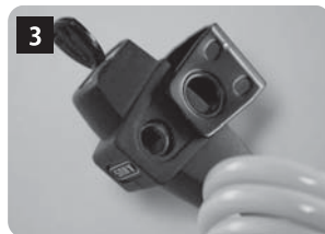
ロックを解除しワイヤーを抜くとLLフォルダーが外れます。