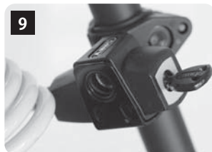
シリンダーの穴とマウントの穴が合っていることを確認します。