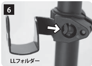
LLフォルダーをURBマウントの溝にしっかりと押し込みます。(多少固いです) LLフォルダーはU時の下側の下向きにします。 ※取付けると外せなくなります。注意してください。